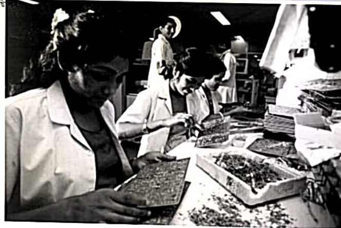
তথ্য এবং অন্যান্য প্রযুক্তি কম বাধা সহ নতুন পরিষেবা এবং পন্থা তৈরি করছে প্রবেশ করতে

সাহায্য করার জন্য আরও মনোযোগ দেওয়া হচ্ছে উন্নয়নশীল দেশগুলি তাদের কঠোর শোনায়ে বাণিজ্য এবং বিনিয়োগের সাথে চুক্তি করে এমন ফো উদাহরণস্বরূপ, দাতারা আলোচনাতে শক্তিশালী করতে উন্নয়নশীল দেশগুলির বহুমুখী ক্ষমতা পায়-রীম ফোরা এবং বিধি প্রণয়ন সংস্থা এবং কাজ হিচ ট্রান-এ উন্নয়নশীল দেশগুলির জন্য সহ দালাল