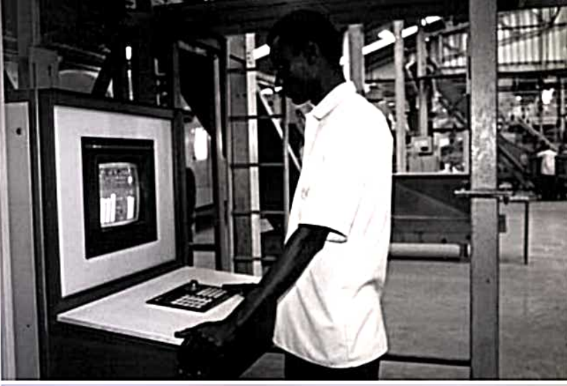
বিষায়নের আরও কৌশলগত দৃষ্টিভঙ্গি পণ্যের গুণমান উন্নত করার জন্য জাতীয় কেন্দ্রগুলিকে উন্নীত করা উচিত, ছড়িয়ে দেওয়া আন্তর্জাতিক মানের তথ্য এবং স্থানীয়ভাবে তৈরি রপ্তানি পণ্য পরীক্ষা।

সরকারী এবং বেসরকারী খাতের মধ্যে কর্ম (in বেসরকারীকরণ এবং বিভাজন, উদাহরণস্বরূপ)। দাতারাও উন্নয়নে সাহায্য করতে প্রস্তুত দেশগুলি তাদের আইন, নীতি এবং প্রযুক্তি নিয়ে আসে উরুগুয়ে রাউন্ডের সাথে সামঞ্জস্যপূর্ণ ক্ষমতা-মন্ত্রণা এবং আন্তর্জাতিক বিনিয়োগ মান, প্রো-এর অধীনে প্রতিষ্ঠিত হওয়া সহ বিনিয়োগের উপর ওইসিডি বহুপাক্ষিক চুক্তি-ment (MAI)।